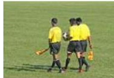
1-ին գիծ. Գծային ղեկավարներ

ՆԱ-ի կողմից իրականացված պաշտպանական երրորդ գծի այս դերը նմանեցվում է ֆուտբոլային խաղի ժամանակ դարպասապահի ունեցած դերի հետ: